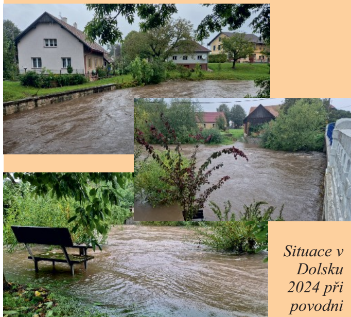
Situace v Dolsku 2024 při povodni